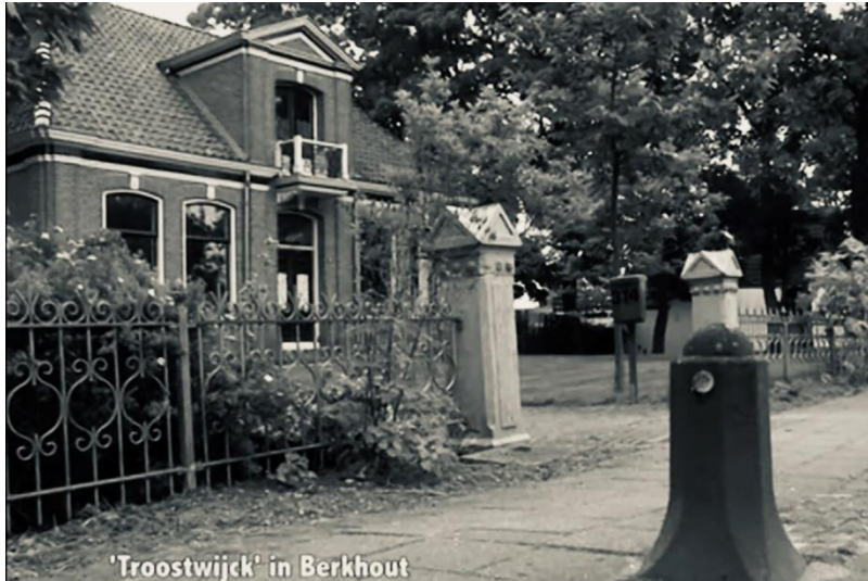
Villa Troostwijck Berkhout, bewerkt screenshot uit documentaire van Peter Sasburg

Het hele stel sliep op zolder, behalve Georges en Henny die een eigen slaapkamer kregen. De ploeg had ook nog eens de beschikking over een ruime zitkamer.