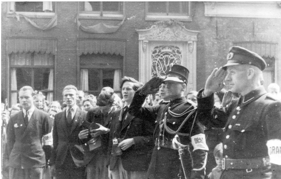
Intocht der geallieerden

De afgelopen maanden is er, na de meest recente opening van de Nationale Archieven, veel gesproken over de misstanden die zich na de oorlog landelijk in Nederlandse kampen en gevangnissen hebben voorgedaan. Ook in Hoorn is dat volgens mijn opa het geval geweest. Volgens hem zijn er zowel bij de arrestaties als bij de bewaking dingen gebeurd die niet hadden moeten gebeuren, zoals hij het formuleerde. Persoonlijk heeft hij feiten gezien die hij beschamend vond. In enkele gevallen heeft hij door zijn functie kunnen ingrijpen.